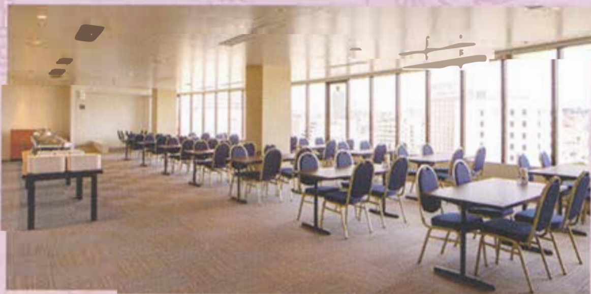
【9階】スカイバンケット 座席:テーブル席 (150席)