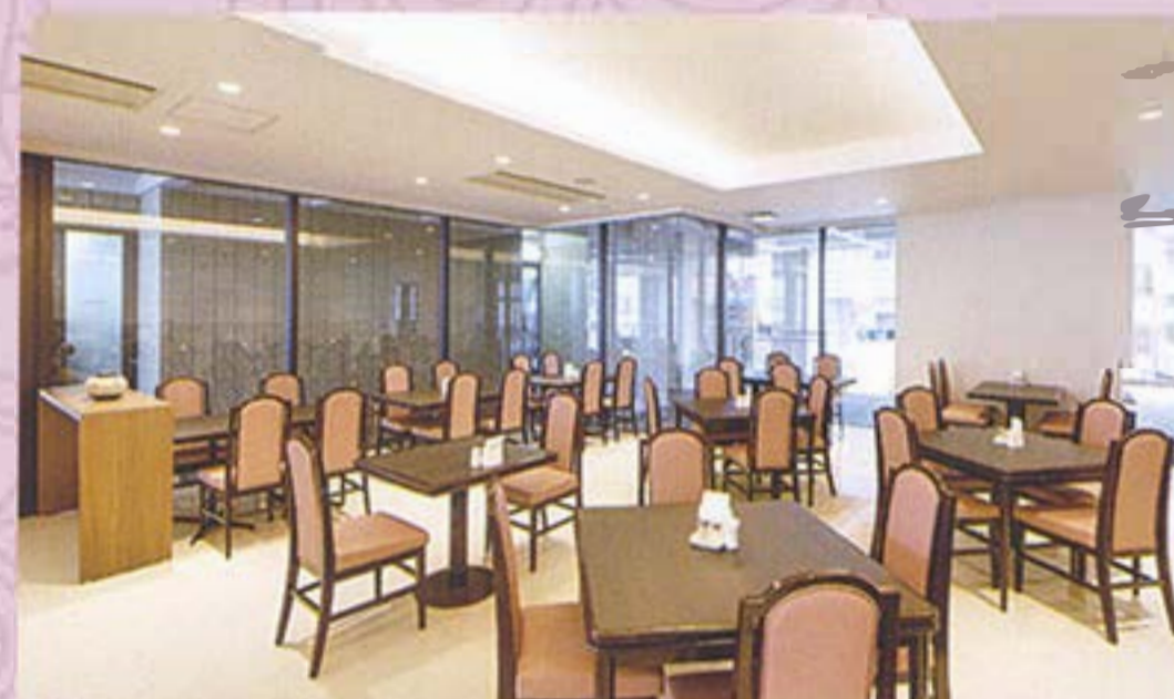
【2階】レストラン「セルフイーユ」

彩りあざやかに、味わい華やかに、季節の素材を活かした、バラエティー豊かな料理がさ さやかな自慢です。 やさしい光の中で、心あたたまるひとときを お過ごし下さい。