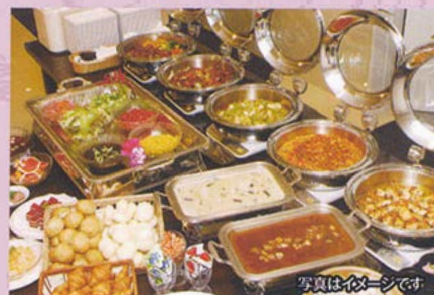
朝食バイキングメニュー