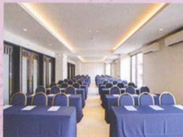
【3階】宴会場:月桃(げっとう) 座席:個室 40席